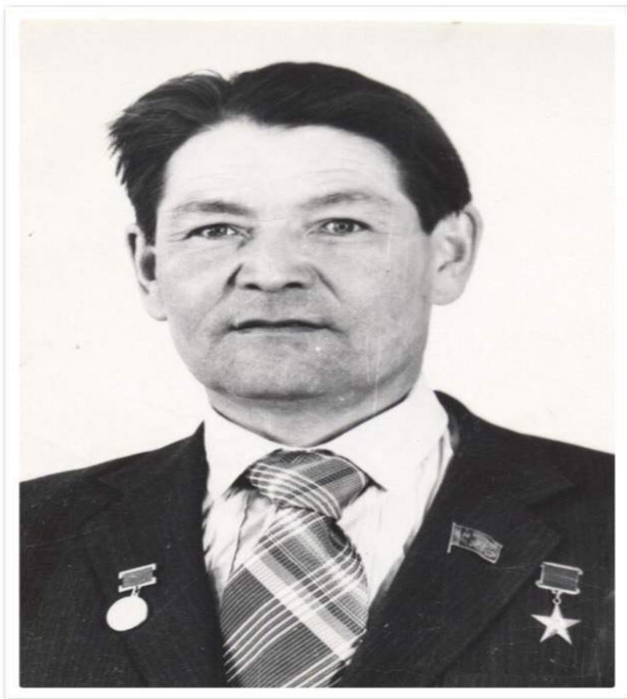
Риза Хажиахметович Яхин – знатный комбайнер, Герой Социалистического Труда (1976), лауреат Государственной премии СССР (1979).