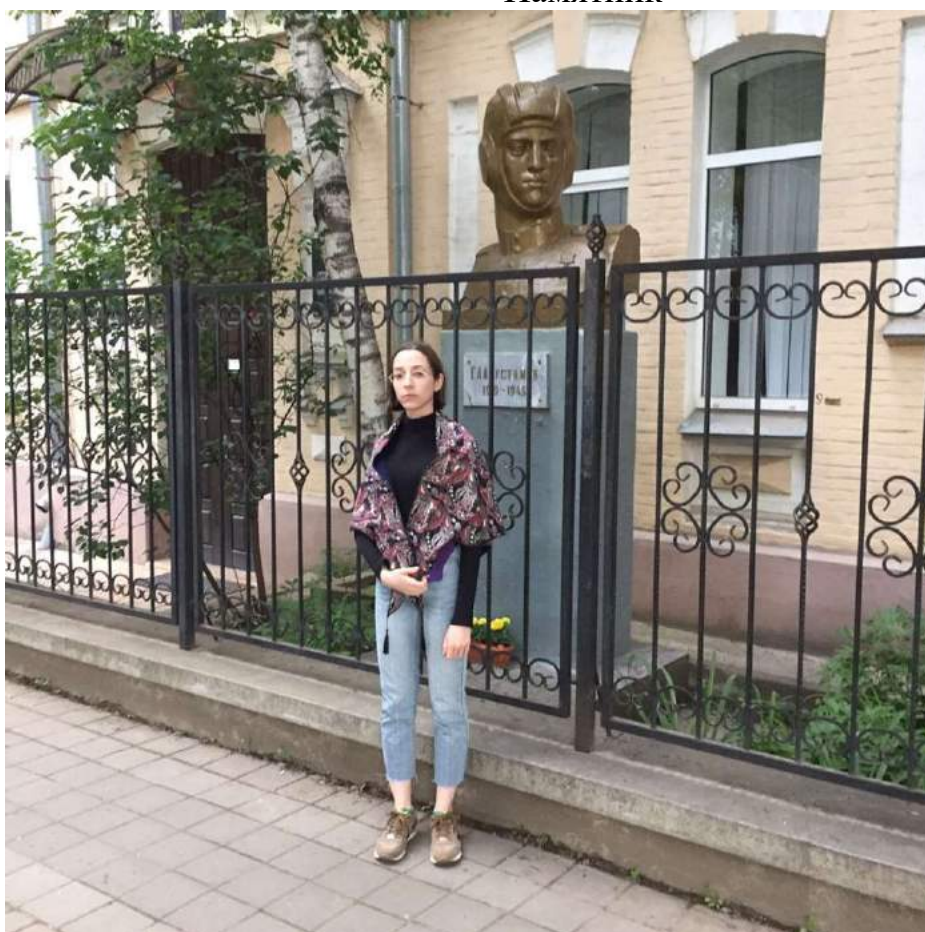
Я на фоне школы и самой большой драгоценности моей семьи